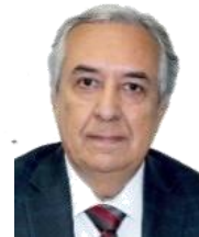
Dip. Alfredo Villegas Arreola